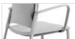
Polipropileno (P.P) inyectado