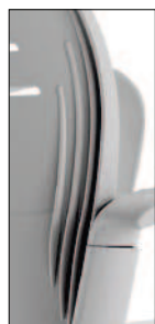
refuerzo del respaldo