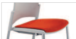
Tapizado con espuma ( 40\text{kg/m}^3 ), acabado del grupo T ó Napel