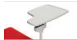
Pala de escritura opcional en fenólico de 13 mm y melamina aluminizada de 16 mm de espesor, se puede colocar a derecha ó izquierda