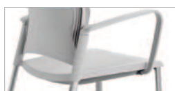
Polipropileno (P.P) inyectado