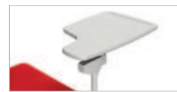
Pala de escritura opcional en fenólico de 13 mm y melamina aluminizada de 16 mm de espesor, se puede colocar a derecha ó izquierda