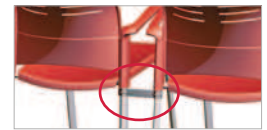
Pinza de unión en Polipropileno (P.P) de 5 mm de espesor