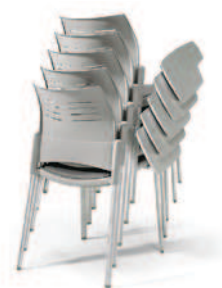
Posibilidad de apilar hasta 5 sillas