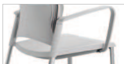
Polipropileno (P.P) inyectado