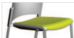
Doble inyección de material SEBS sobre carcasa rígida de (P.P) con partículas minerales