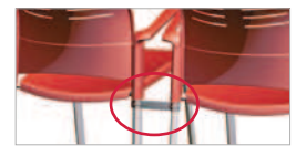
Pinza de unión en Polipropileno (P.P) de 5 mm de espesor